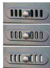
Regulación manual del aire secundario.